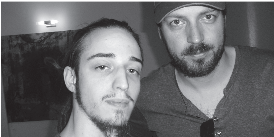
Kiss Benedek Áron és Pálfi György filmrendező